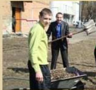
Надання допомоги тим, хто цього потребує