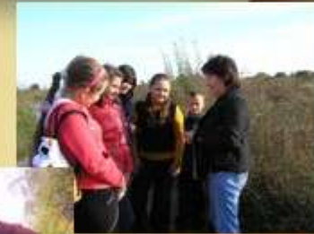
Збирання лікарських рослин